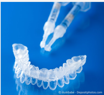
Bleaching-Form aus Kunststoff, in die Sie das Aufhellungs-Gel einfüllen.

In diese füllen Sie zu Hause das sog. Bleaching-Gel, das Sie vom Zahnarzt bekommen. Dann stülpen Sie die Form über Ihre Zähne und lassen das Gel einwirken.