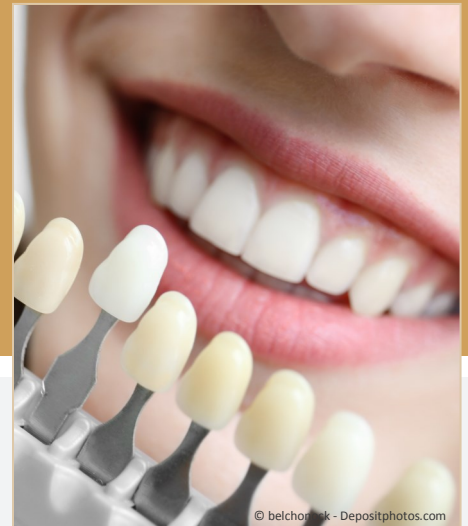
Bleaching vom Zahnarzt: Gewinnendes Lächeln mit strahlend weißen Zähnen

Dunkle Zähne können ein ziemliches Ärgernis sein: Obwohl sie sauber geputzt sind, wirken sie einfach nicht hell. Die Folge ist: Man traut sich oft nicht mehr, unbefangen zu reden und zu lächeln. Man achtet darauf, dass andere die Zähne nicht sehen. Und wenn man fotografiert wird, lässt man den Mund lieber zu. Das muss nicht sein: Zähne können heute mit bewährten Methoden wieder aufgehellt werden. Professionelles Bleaching beim Zahnarzt ist die Lösung!