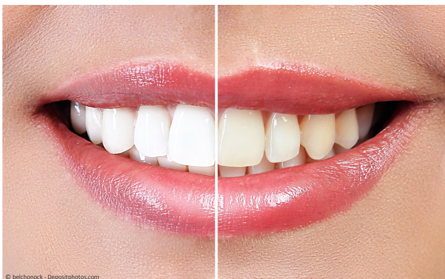
Deutlicher Unterschied: Professionelles Bleaching beim Zahnarzt wirkt!

Vertrauen Sie Ihre Zähne besser Profis an!